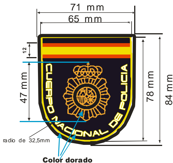
FIGURA 4 DISTINTIVO GENERAL DE BRAZO

De una sola pieza de doble tejido del mismo que el utilizado en los refuerzos, justo debajo del Distintivo bordado, e igualmente centrado sobre la pieza de tejido, se ha situado un bolsillo, con pespunte por el contorno, medidas terminado de 150 mm de altura y 55 mm de anchura, con cartera de 60 mm de altura, dejando útil de fondo de bolsillo unos 125 mm, dobladillo de 10 mm el borde y ocultando los laterales entre el tejido de punto y la cara interior de tejido. Para el cierre de la cartera se ha situado centrada a unos 10 mm del borde por la parte interior, una pieza de cinta tipo "Velcro" de unos 20 x 20 mm parte ganchos, y la parte Astracán en correspondencia sobre el parche.